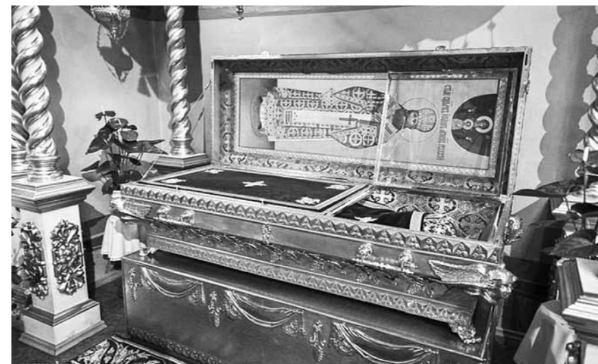
Рака с мощами Иоанна Рижского в соборе Рождества Христова в Риге (Латвия)

О нем много писали журналисты, владыку любила не только паства, он был очень популярен как политик. Только став депутатом Сейма, он смог законодательно защищать интересы Православной Церкви, которая тогда испытывала притеснения от действующей власти, у нее отбиралось имущество, на приходах не хватало пастырей.