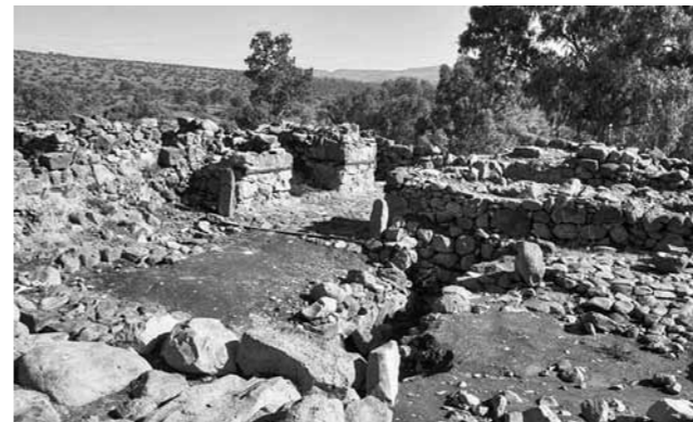
Руины Вифсаиды (Израиль)