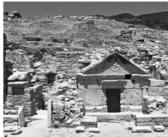
Гробница апостола Филиппа в Памуккале (Турция)

Спустя почти полвека с момента Вознесения Христа, апостол Филипп с апостолом Варфоломеем и Мариамной прибыли в город Иераполис Фригийский (Иераполис в переводе означает «Священный город»). Его руины находятся в Турции, в Памуккале.