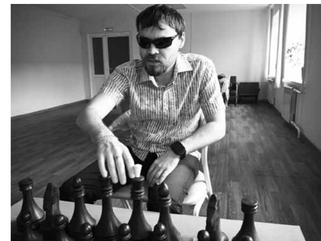
Шах и мат