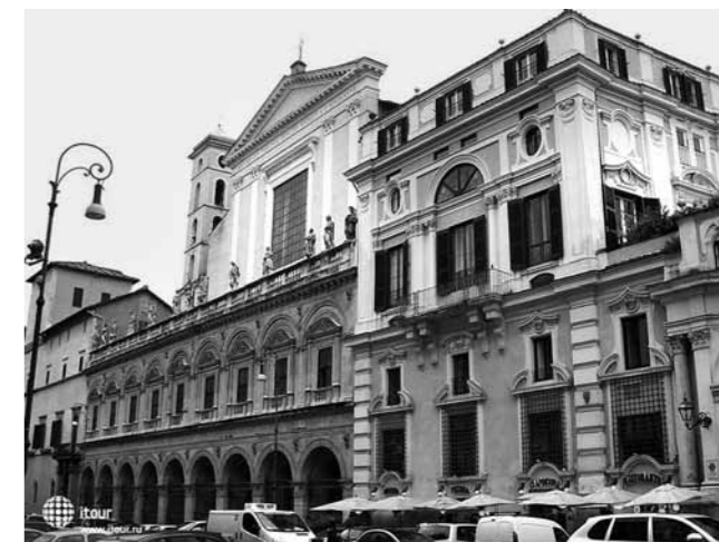
Храм Санти-Апостоли в Риме, где покоятся мощи апостола Филиппа

Две тысячи лет назад в этих местах жили люди, поклонявшиеся гигантской змее – ехидне, которая обитала в главном храме города. Повсюду в Иераполисе стояли языческие храмы в честь этой змеи. И это при том, что очень часто в тех местах змеи кусали людей, но жители из страха продолжали поклоняться гигантской змее.