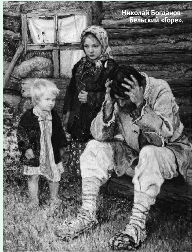
Николай Богданов-Бельский «Горе».